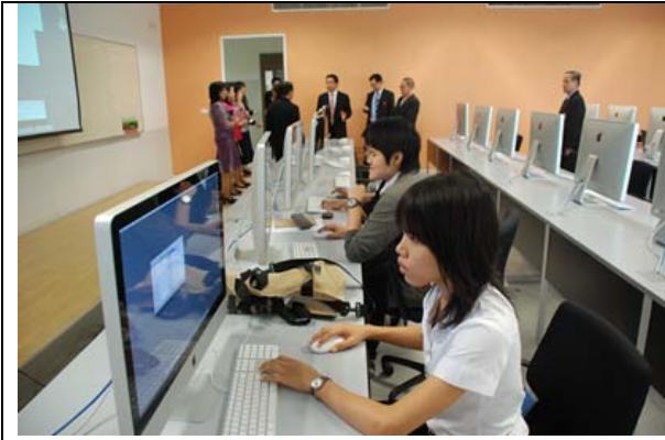
คณะกรรมการ เยี่ยมชมห้องคอมพิวเตอร์ที่ทันสมัย (Mac PC room)