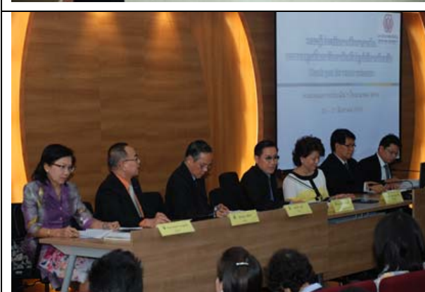
คณะกรรมการ รายงานผลการประเมินด้วยวาจา แก่คณะผู้บริหารมหาวิทยาลัย คณาจารย์ เจ้าหน้าที่ และผู้ที่มีส่วนเกี่ยวข้องต่างๆ