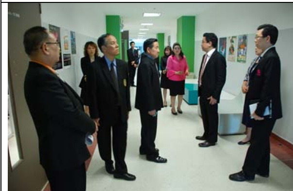
คณะกรรมการ เยี่ยมชมการดำเนินงาน ของคณะดิจิทัลมีเดีย