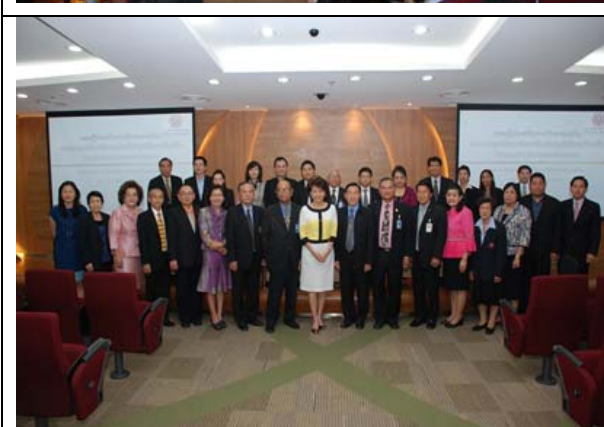
คณะกรรมการ ถ่ายภาพร่วมกับ คณะผู้บริหารมหาวิทยาลัย