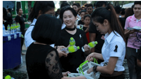
纪念九世先皇、志愿分发饮用水活动

The values of USR obtained were caring for each other and the collective interest over individual interest. School of Accountancy organized the Power of Volunteering project to distribute USR drinking water, borneo camphor, and towel in order to dedicate to the tomb of His Majesty the King Bhumibol Adulyadej on October 21, 2016 at Sanam Luang, aiming to create generosity for students, make sacrifices, and share for each other. Another purpose was to recognize the grace of His Majesty King Bhumibol, King Rama IX. The result of the project enabled students to be generous and kind to the participants.