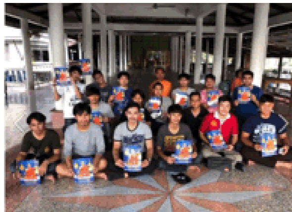
社区发展志愿服务项目 (Suntikaram 寺)

From 28-30 April 2016, the Volunteer Engineers for Community Development projects at Wat Sunthornnikaram, Canal 2, Nong Suea Pathumthani organized a volunteer project to bring knowledge to the community and to implement the project which was to renovate the temple wall buildings, and to improve the electrical systems and air conditioning systems that were not working properly.