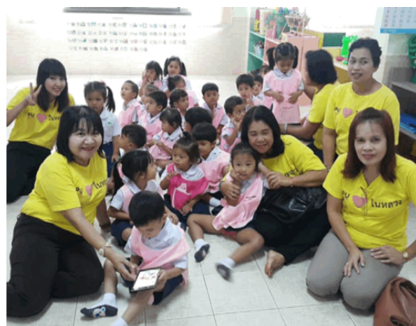
ศูนย์เด็กเล็กท้ายเกาะ Thai Ko Health Promoting Hospital 泰高幼儿教育中心