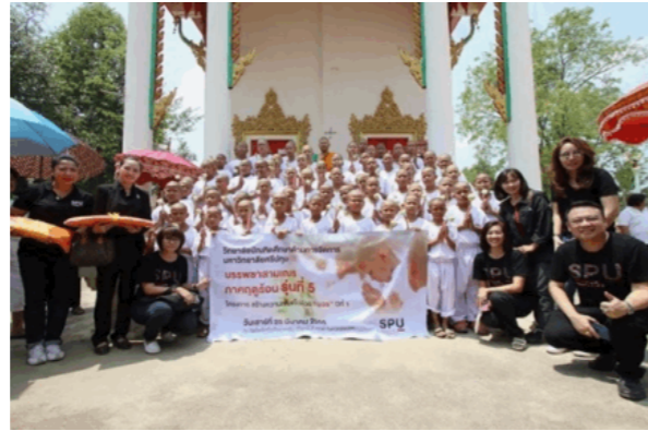
2017年暑期第5届寺庙布施活动

USR参与者获得的正能量价值观:诚信、慷慨、集体利益高于个人利益、尊重自己和他人。