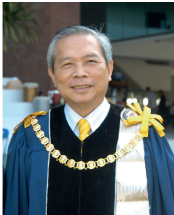
สารจากนายกสภามหาวิทยาลัยศรีปทุม

ในอดีต มหาวิทยาลัยคือสถานศึกษาของคนหนุ่มสาวที่กำลังเลือกที่จะประกอบวิชาชีพอะไรดี ดังนั้นแวดวงที่มหาวิทยาลัยเกี่ยวข้องจึงมีแต่อาจารย์ และ นิสิตนักศึกษา เท่านั้น. ต่อมามหาวิทยาลัยตระหนักว่างานสอนในแวดวงแคบๆนี้ไม่เพียงพอที่จะทำให้ประเทศเจริญก้าวหน้าได้. มหาวิทยาลัยจึงขยายความสนใจออกไปให้กว้างขวางมากขึ้น เริ่มจากศึกษาความต้องการของผู้ใช้บัณฑิต ไปสู่ความต้องการของนักธุรกิจและผู้ประกอบการ, นักการเมือง, หน่วยงานราชการ, นักบวช, ศิลปิน, ผู้ใช้แรงงาน และ ชุมชนทั้งในเมืองและชนบท. ความสนใจนี้ทำให้มหาวิทยาลัยได้รับรู้ว่า ยังมีบทบาทอีกมากที่มหาวิทยาลัยควรดำเนินการเพื่อช่วยเหลือสังคมและประเทศไทย. โดยที่บทบาทของหน่วยงานไทยถูกผูกมัดด้วยโซ่ตรวนของกฎหมาย มหาวิทยาลัยจึงไม่สามารถทำอะไรได้โดยพลการและใช้วิธีที่จะช่วยเหลือสังคมโดยการใช้อนุเคราะห์ที่ได้ผลทางธุรกิจมาแล้ว นั่นก็คือ Social Responsibility. ความจริงแล้ว คำนี้ไม่ได้ใช้เฉพาะสำหรับหน่วยงานธุรกิจ หรือ มหาวิทยาลัย. แต่เป็นคำที่แสดงความรับผิดชอบของทุกหน่วยงานไปจนถึงแต่ละบุคคลที่จะต้องดำเนินการเพื่อประโยชน์แก่สังคมในภาพรวม. อีกนัยหนึ่งคือ สามารถตอบคำถามได้ว่า เมื่อเกิดมาในชาตินี้ ได้ทำประโยชน์อะไรแก่ประเทศชาติบ้าง.