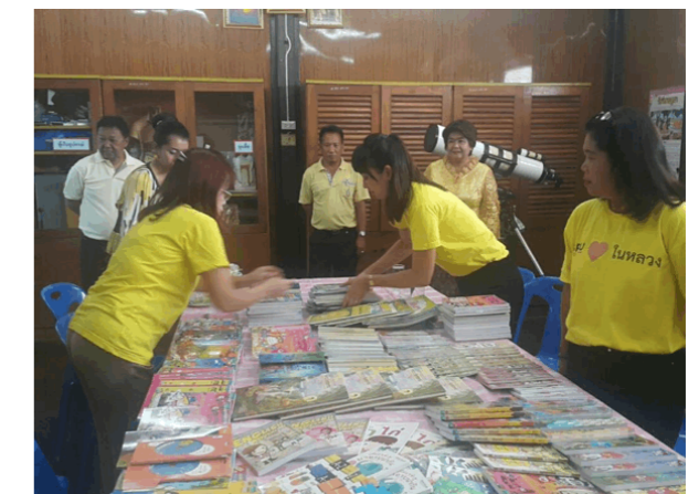
โรงเรียนศรีบางไทร Sribangsai School 四巴赛中学