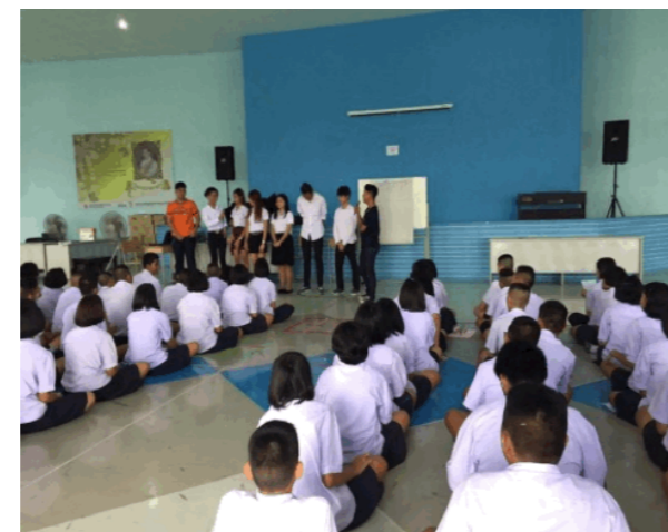
姊妹学校献爱心活动

USR活动的参与者都贯彻七项活动宗旨： 互助互爱、乐于助人，勇于奉献、礼貌待人、乐善好施、爱护环境 2559年8月2日，工商管理学院在邦博中学举办姊妹学校献爱心活 动，此次活动在于传达珍爱生命，远离危险，学会勤俭节约，不铺张浪 费。从此次活动的开展过程中，初中2-3年级的学生学习到了一系列的生 活知识，并且和学院的师生建立了深厚的感情。