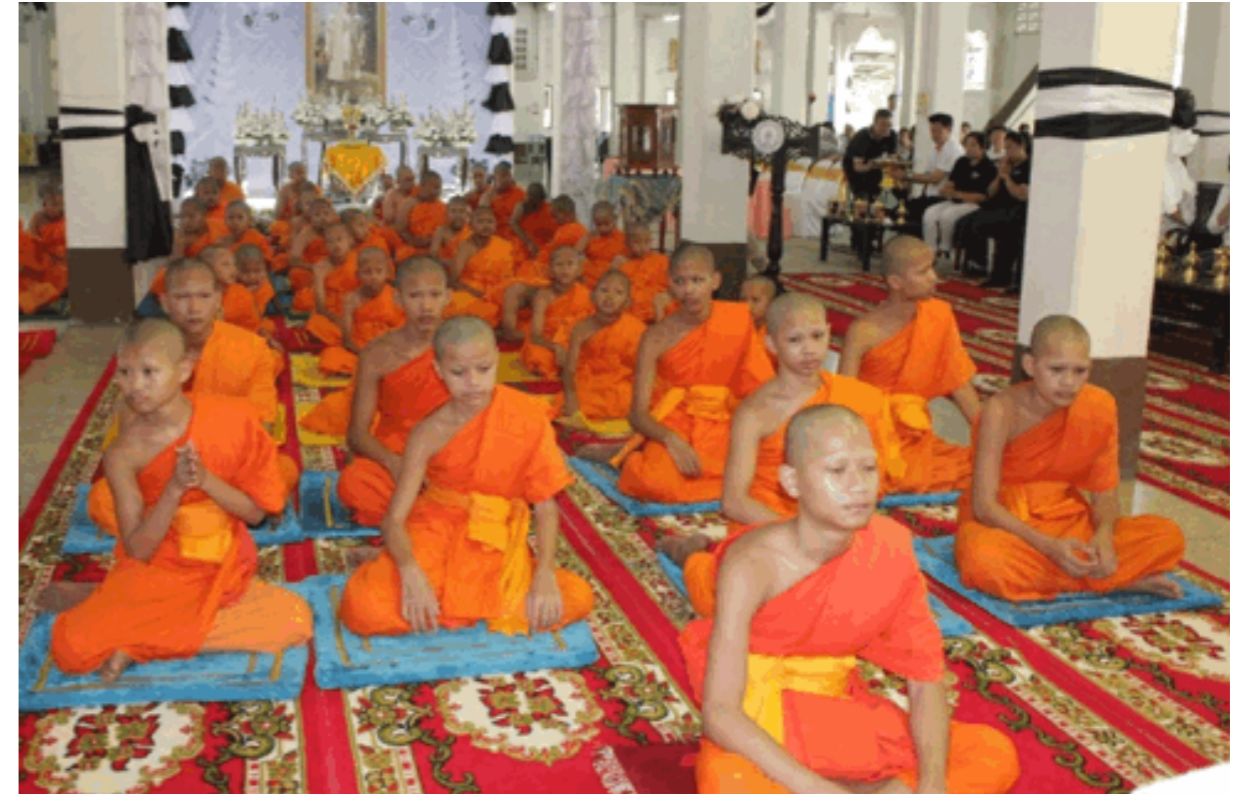
Summer Novitiate Project, Season 5, 2017

以上爱心机构共捐款266,974泰铢、5袋大米(每袋重25公斤),并向寺中僧人捐赠干粮。