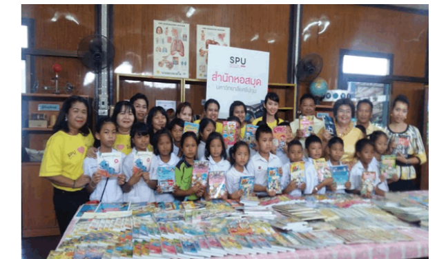
โรงเรียนศรีบางไทร Sribangsai School 四巴赛中学

互助互爱、乐于助人，勇于奉献、礼貌待人、乐善好施、爱护环境 2559年6月9日，斯巴顿图书馆在巴吞他尼府泰高县幼儿中心以及大城府四巴赛中学举行爱心捐赠图书以及传授文化知识活动，此次活动宗旨在于改善周边相关教育机构的图书教学资源现状，为学生们提供更新更全的图书资料，目的在于为社区各界人士和图书馆间建立合作关系，培养团结一致互助合作的精神。从此次活动中图书馆和社区各界人士及其学校间建立起长久互助合作的友好关系，为好人好事的事迹树立了榜样，陶冶了新一代年轻人的社会价值观，树立了良好的社会风气。