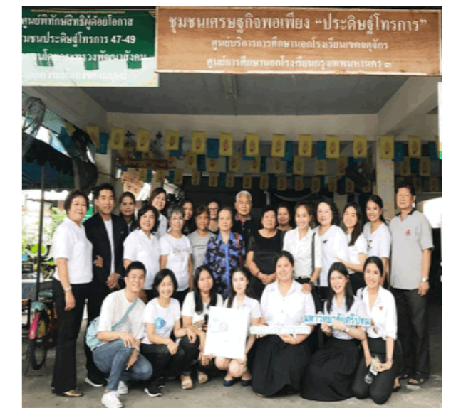
第二届“学术服务进社区”活动

คณะบริหารธุรกิจ จัดโครงการบริการวิชาการสู่สังคมของชุมชน ปีที่ 2 วันที่ 4 พฤษภาคม 2560 ณ ศูนย์บริการการศึกษาออกโรงเรียนเขตจตุจักร โดยมีวัตถุประสงค์เพื่อให้ความรู้เรื่องการตลาดออนไลน์กับกลุ่มผู้ผลิตเครื่องทองลงหิน(ช้อนส้อม กำไลข้อมือ) จากการดำเนินการได้ถ่ายทอดความรู้ กลยุทธ์ด้าน การตลาดออนไลน์ และผลิตภัณฑ์ที่มีชื่อว่า Bronze Craft Center Handmade In Thailand กับผู้นำชุมชนและกลุ่มแม่บ้านของชุมชนประดิษฐ์โครงการ