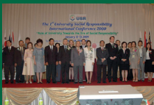
สัมมนาระดับนานาชาติ ด้านบทบาทของมหาวิทยาลัย ในความรับผิดชอบต่อสังคม ครั้งที่ 1