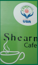
โครงการ USR Shearn Café (Share & Learn)