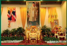
โครงการอุปสมบท ปฏิบัติธรรม เฉลิมพระเกียรติ