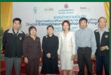
โครงการพัฒนาศักยภาพ ผู้ประกอบการทาสีสังคม (Social Entrepreneurs Development Program)