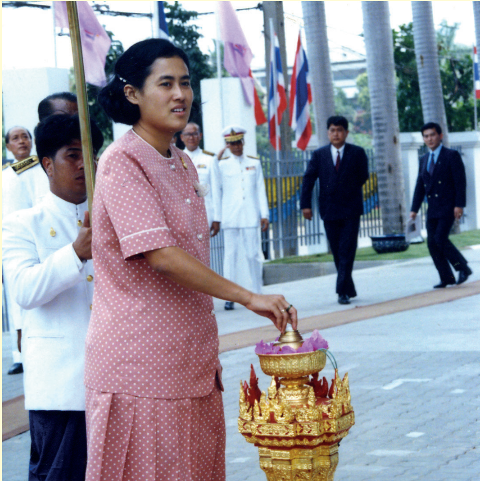
สมเด็จพระกนิษฐาธิราชเจ้า กรมสมเด็จพระเทพรัตนราชสุดา เจ้าฟ้ามหาดจรัสสิรินธร มหาวชิราลงกรณวราชภักดี สิริกิจการิณีพิรยพัฒน รัฐสีมาคุณากรปิยชาติ สยามบรมราชกุมารี เสด็จพระราชดำเนินทรงเป็นประธานเปิด อาคาร “ดร.สุข พุคยากรณ์” เมื่อวันที่ 30 มีนาคม 2536