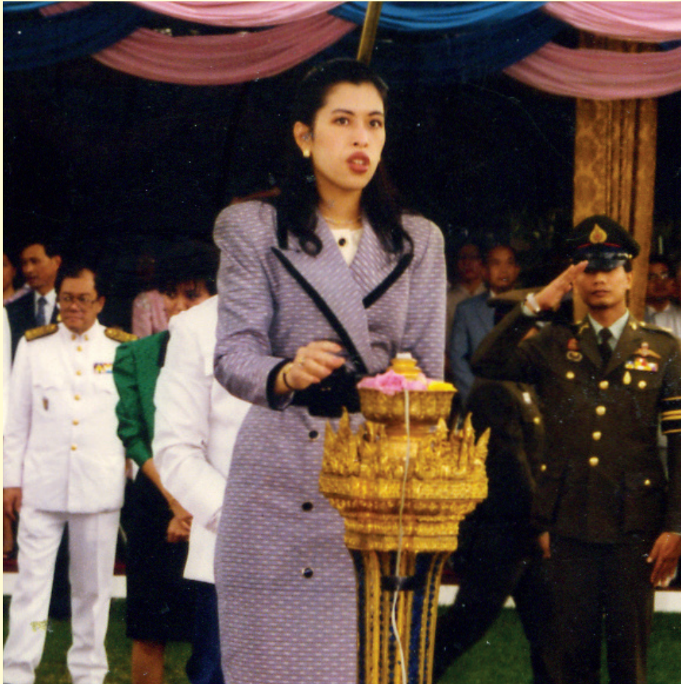
สมเด็จพระเจ้าน้องนางเธอ เจ้าฟ้าจุฬาภรณวลัยลักษณ์ อัครราชกุมารี กรมพระศรีสวางควัฒน วรขัตติยราชนารี เสด็จพระราชดำเนินมาทรงกดปุ่มไฟฟ้าเปิดแพรคลุมป้ายนาม “มหาวิทยาลัยศรีปทุม” เมื่อวันที่ 29 ธันวาคม 2530