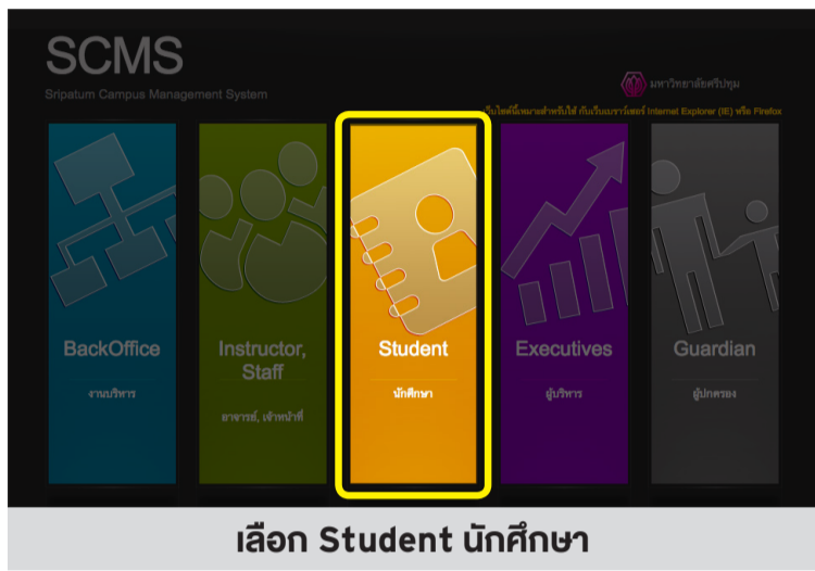
เลือก Student นักศึกษา