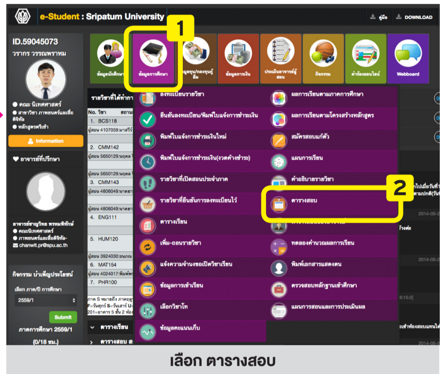
เลือก ตารางสอบ

หากตรวจสอบแล้ว ไม่มีห้องสอบ / เลขที่นั่งสอบ สาเหตุจากค้างชำระ ให้ดำเนินการดังนี้