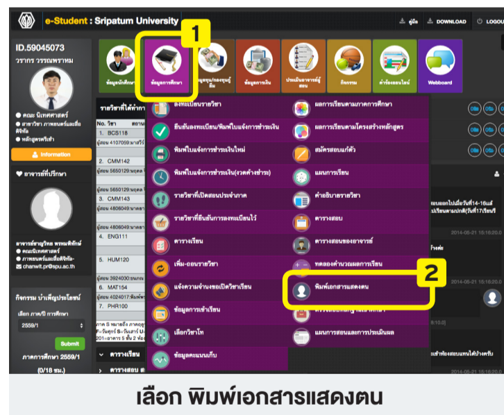
เลือก พิมพ์เอกสารแสดงตน

ให้ดำเนินการ Log in เข้าสู่ระบบ e-Student แล้วพิมพ์เอกสารแสดงตน